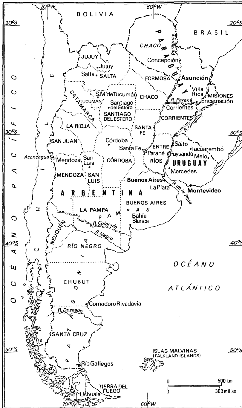
Argentina, Uruguay y Paraguay